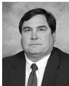
Wales Barksdale Chair

El Consejo Educacional del Condado de Rockdale es compuesto por siete miembros elegidos en general por términos de cuatro años. El Consejo es la junta directiva oficial del sistema escolar.